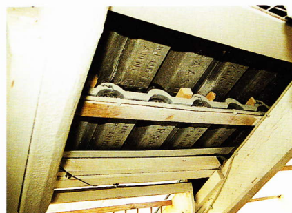
Unter die Pfannen geschobene Holzkeile sorgen für zusätzliche Luft