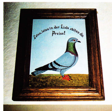
Motto der SG Dreyer! ...und in der Liste stehen sie bei ihnen reichlich

Während des Freiflugs werden die jeweils freien Abteile sowohl morgens wie abends gereinigt. Auf Sauberkeit legen die Dreyers ganz besonderen Wert. Sicherlich macht das Zellenöffnen und -schließen, beides sowohl beim Morgentraining als auch beim Abendtraining, Arbeit, aber wie heißt es doch: Ohne Fleiß kein Preis; und