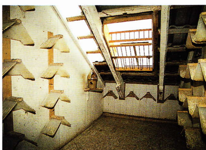
Im Weibchenabteil und in allen anderen: hochstehende Tränken + Ionisatoren