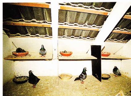
Drei „Senioren“-Zuchtpaare, in der Mitte der Stammvogel „908“