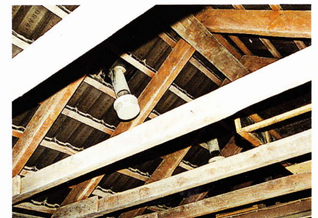
Evtl. durch die Lüfter kommender Regen wird so aufgefangen und verdunstet