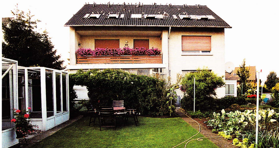
Die Reiseschläge unter dem Dach. Von links: 1. Ausflug Jungtiere, 2. Ausflug Weibchen, 3. Ausflug erstes Vogelabteil, 4. und 5. Ausflug zweites Vogelabteil

„Auf Jungtiererfolge legen wir nicht soviel Wert, obwohl wir auch hier schon gerne ganz vorne wären. So wie wir sie aber aus dem Regal schicken, scheint es eben nicht auszureichen. Wir müssen uns hier mal was einfallen lassen“, so Karl-Heinz Dreyer zu diesem Thema.