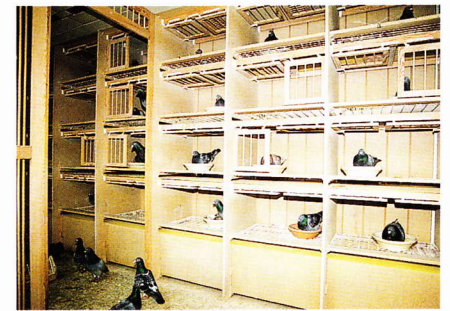
Eins der Vogelabteile; wie bei den Jungen Kotbänder